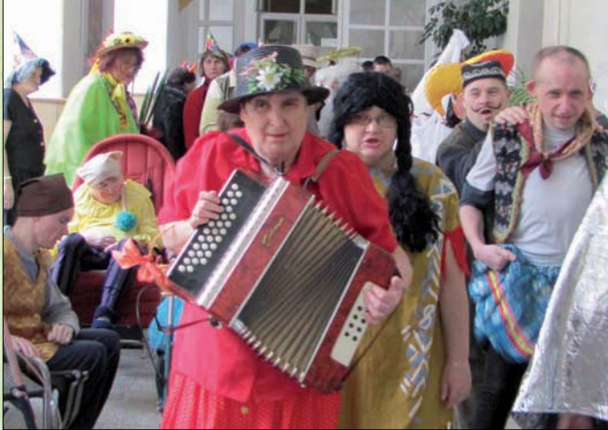
Karneval na zámku v Břežanech.