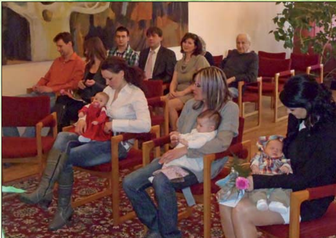
Vítání občánků v Božicích.