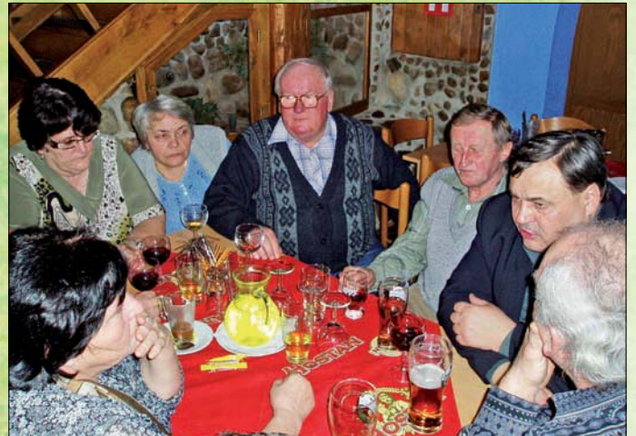
Setkání čejkovických seniorů.