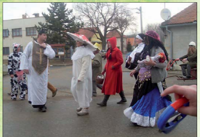
Z masopustního průvodu v Boroticích.