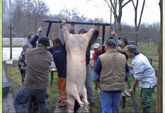
Zabíjačka v Čejkovicích.